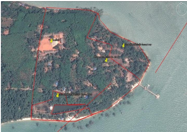
บริเวณที่ดินราชพัสดุ แปลง พง.150